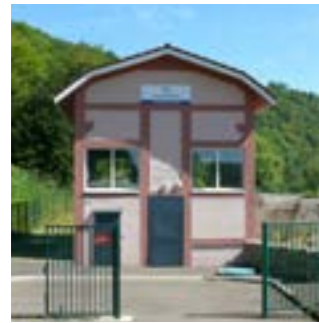
Réhabilitation puits de Haropré eau potable

Rue Jean-Macé chemisage continu : 57 091 € HT