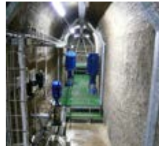
Équipement et mise en service eau potable puits Côtes des Roches - Montant réhabilitation des deux puits : 539 000 € HT